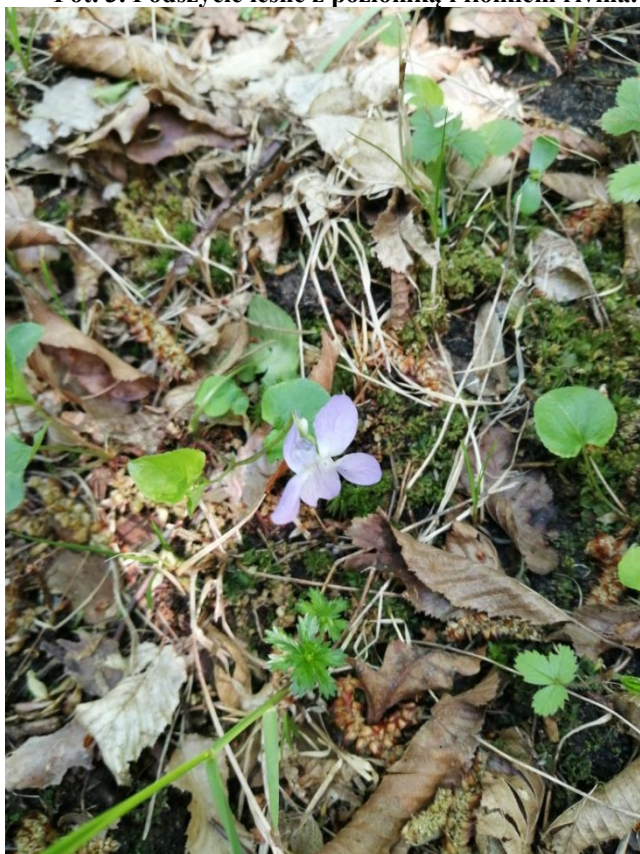
Fot. 3. Podszybie leśne z poziomką i fiołkiem rivina.