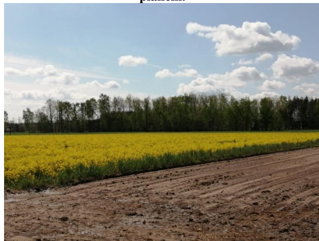
Fot. 6. Uprawy rzepaku w części południowej obszaru objętego planem.