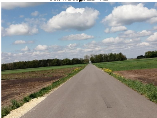
Fot. 7. Droga KDW.1.