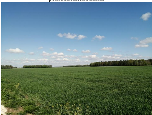
Fot. 1. Widok z drogi KDW.1 w kierunku północnozachodnim.