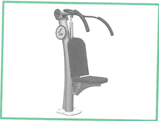
-urządzenie do ćwiczenia mięśni ramion i barków