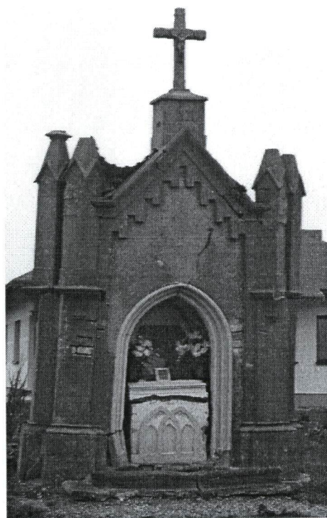
Fot. Zabytkowa kaplica z 1919 r. w Rawicy

swojej „małej ojczyzny”. Jedną z powszechnie znanych opowieści wśród tutejszej ludności jest przekaz mówiący o wzniesieniu murowanej kaplicy we wsi Rawica w 1919 r. W miejscu gdzie według tradycji znajdowała się mogiła żołnierzy pochodzących z oddziałów armii austriackiej stacjonujących w tych okolicach.