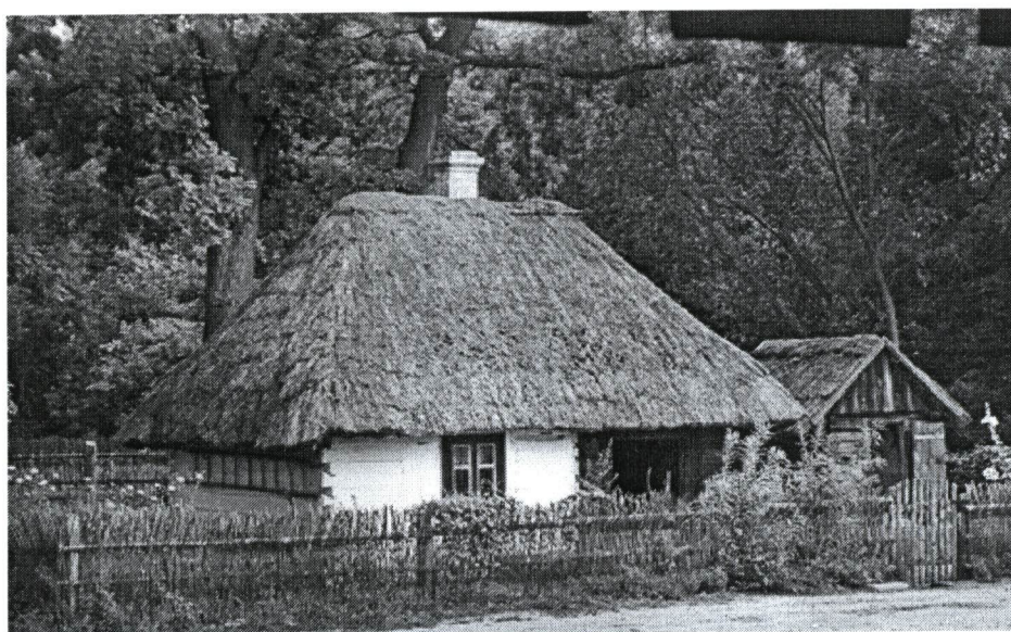
Fot. Chałupa biedniacza z Bartodziejów z 2 poł. XIX w.

Zabytki archeologiczne z obszaru gminy, pozyskane w czasie stacjonarnych badań wykopaliskowych, prac sondażowo-weryfikacyjnych, prospekcji powierzchniowej lub przypadkowych odkryć znajdują się w zbiorach działu archeologii Muzeum im. Jacka Malczewskiego w Radomiu.